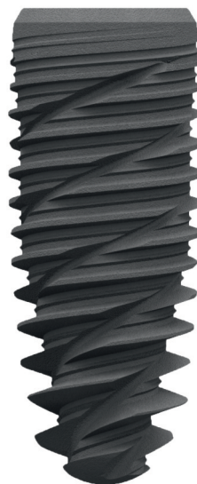
Fig. 1 / Implant Kontakt®.

The length and diameter of each implant were recorded and compiled in a chart.